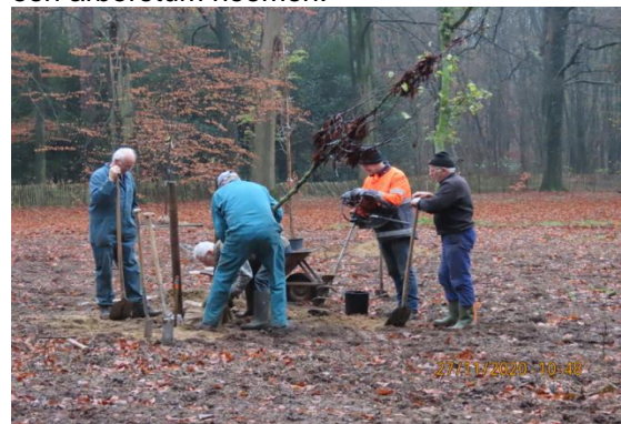
Foto van het planten van de nieuwe bomen in het Parkbos door de Vrienden

Daarnaast wordt nog het Frans hekwerk, waar nodig, hersteld en worden bij de nieuw geplante bomen nog paaltjes geplaatst met hierop een plaatje met de Nederlandse en Latijnse naam. In totaal staan er in het Parkbos nu meer dan 50 verschillende soorten bomen. Hierdoor mogen wij dit Parkbos nu ook rustig een arboretum noemen.